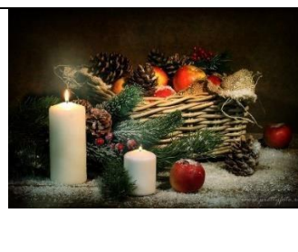
А) Новый год